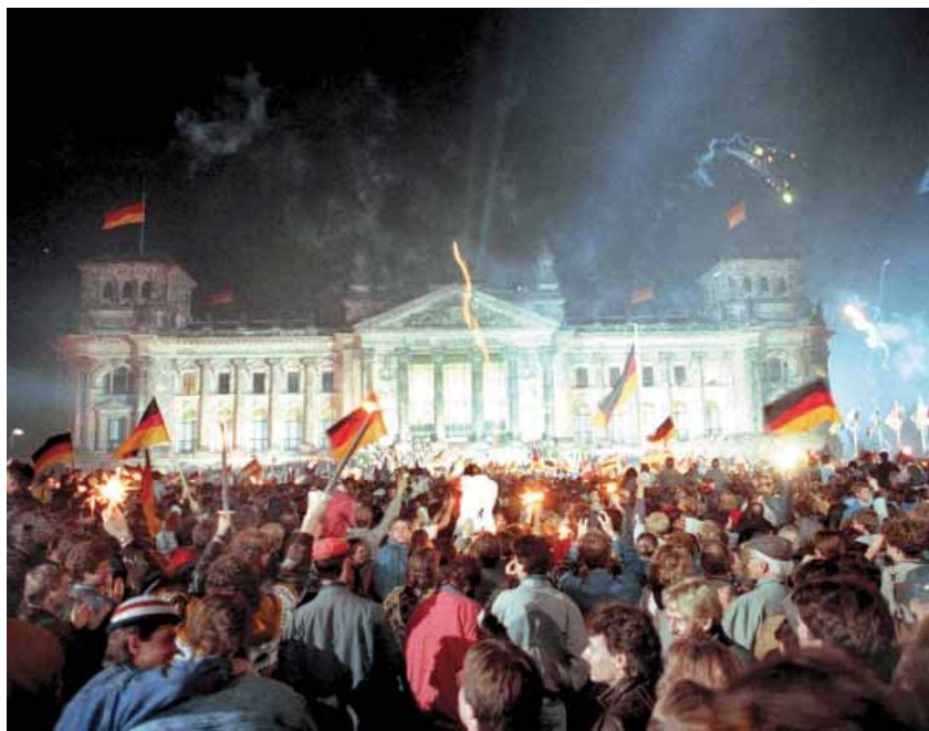
Comemorando a reunificação diante do Reichstag em Berlim, 1990