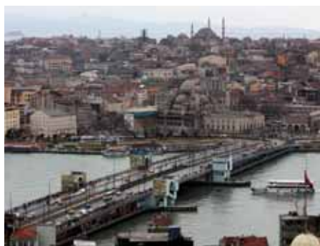
Istambul com a ponte Gálata