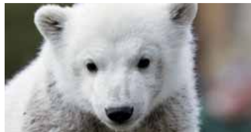
Knut quando pequeno

Ele se chama Knut e continua sendo o animal mais famoso do Jardim Zoológico de Berlim, mesmo depois de crescido, com um ano e meio de idade. O documentário Knut – Ein Eisbär entdeckt die Welt / Knut the Polar Bear Explores the World / Knut – Un oso polar descubre el mundo (Knut – um urso-polar descobre o mundo) faz uma retrospectiva: Knut aos seis meses de idade, branco como a neve e internacionalmente famoso (transmissão 2 - 4 de outubro).